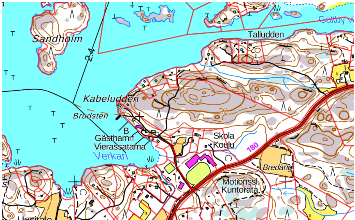
Bild 1. Översikt