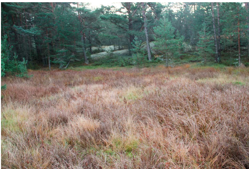
Pieni soistuma alueen länsiosassa