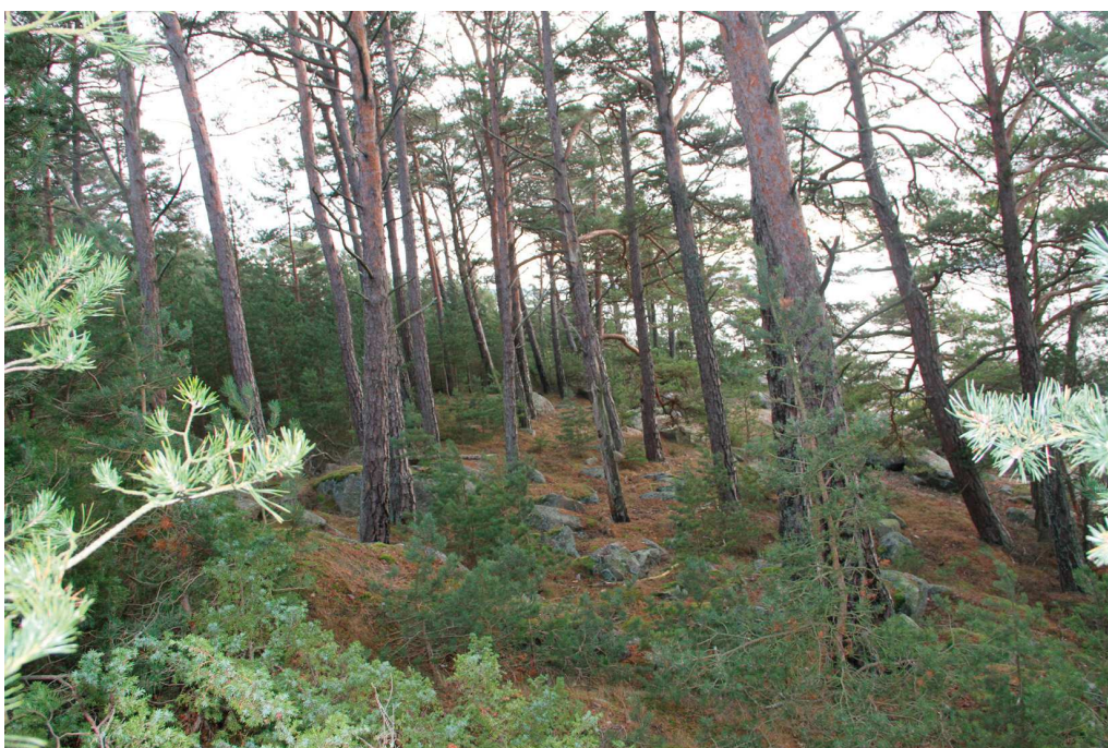
Saaren itäpäässä kasvaa runsaasti nuorta mäntyä