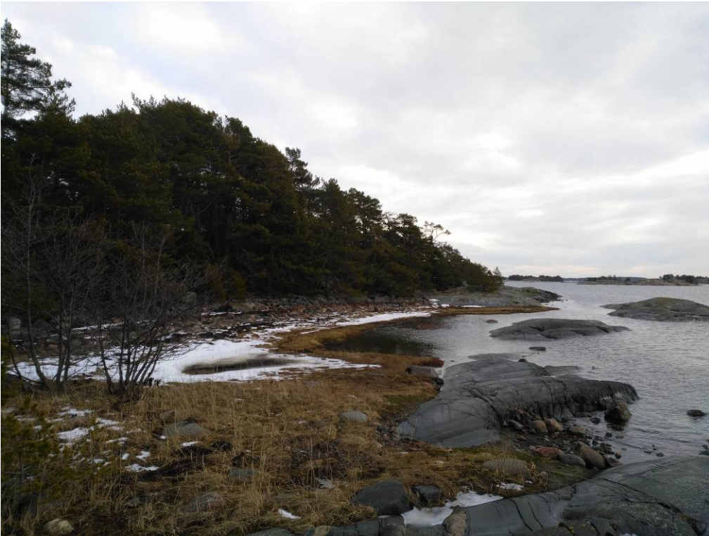
Kaava-alueen itäosan etelärantaa