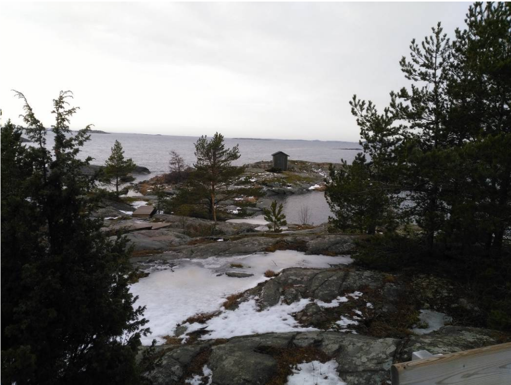
Kaava-alueen länsiosan etelärantaa