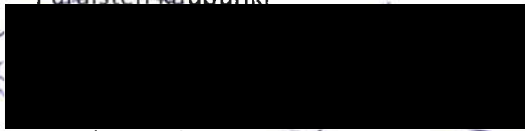
Patrik Nygrén kaupunginjohtaja