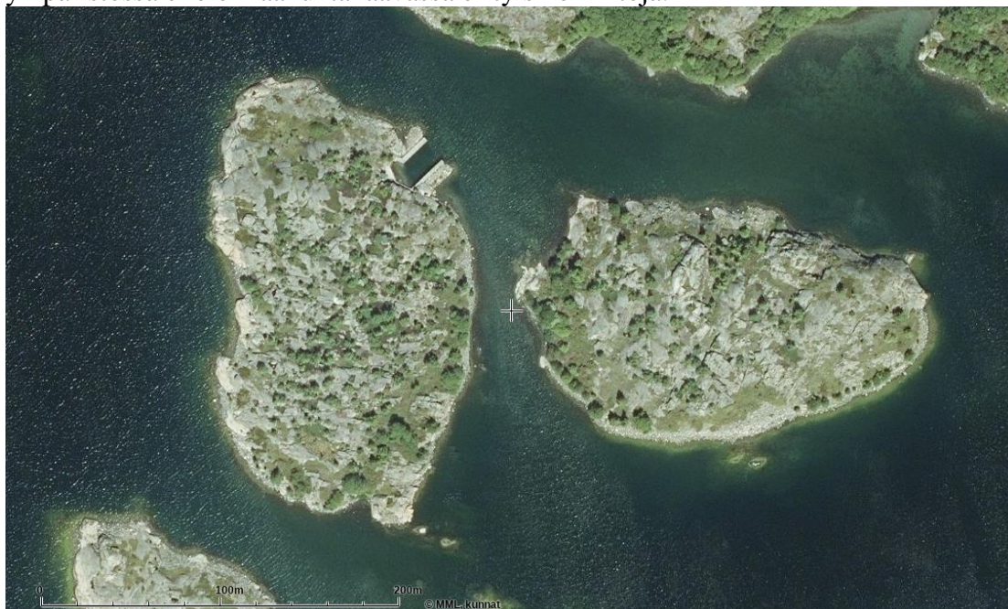
Båtskären ja Trollkobben-saarten ilmakekuva.

Maakuntakaavassa, joka ohjaa yleiskaavan muuttamista koko Borstötä luokitellaan kulttuuriympäristön ja maiseman kannalta tärkeäksi alueeksi. Trollkobbenin ympäristössä ei ole maakuntakaavassa erityismerkintöjä.