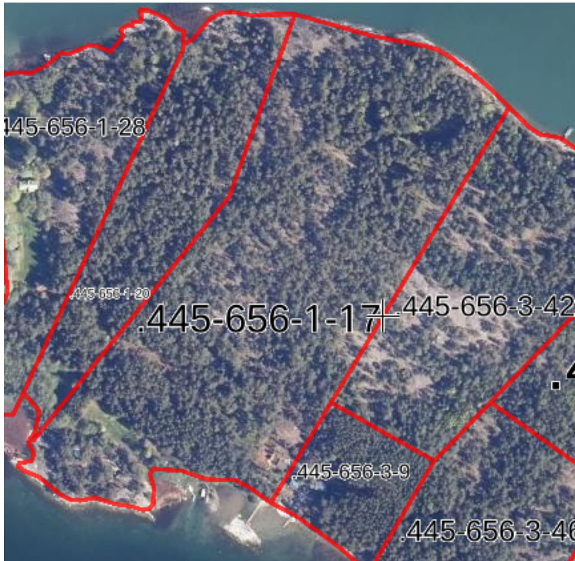
Hesteklinter 1-17 Maanmittauslaitoksen ilmakuvassa.