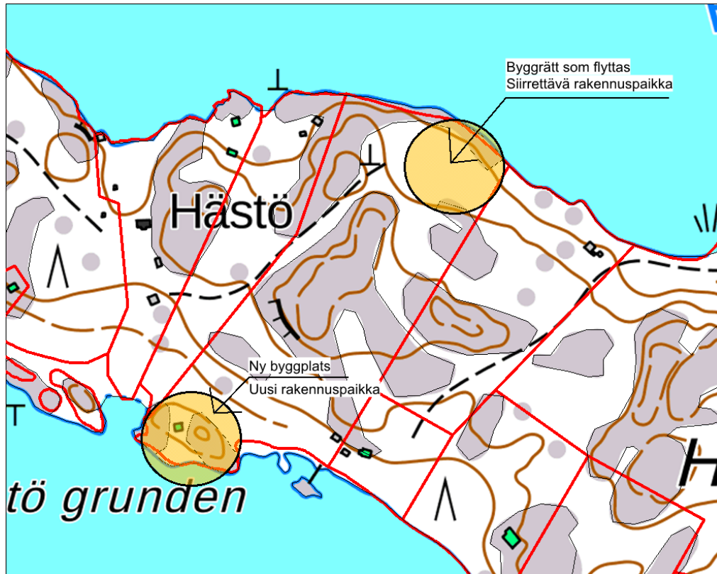
Uuden rakennuspaikan sijainti.