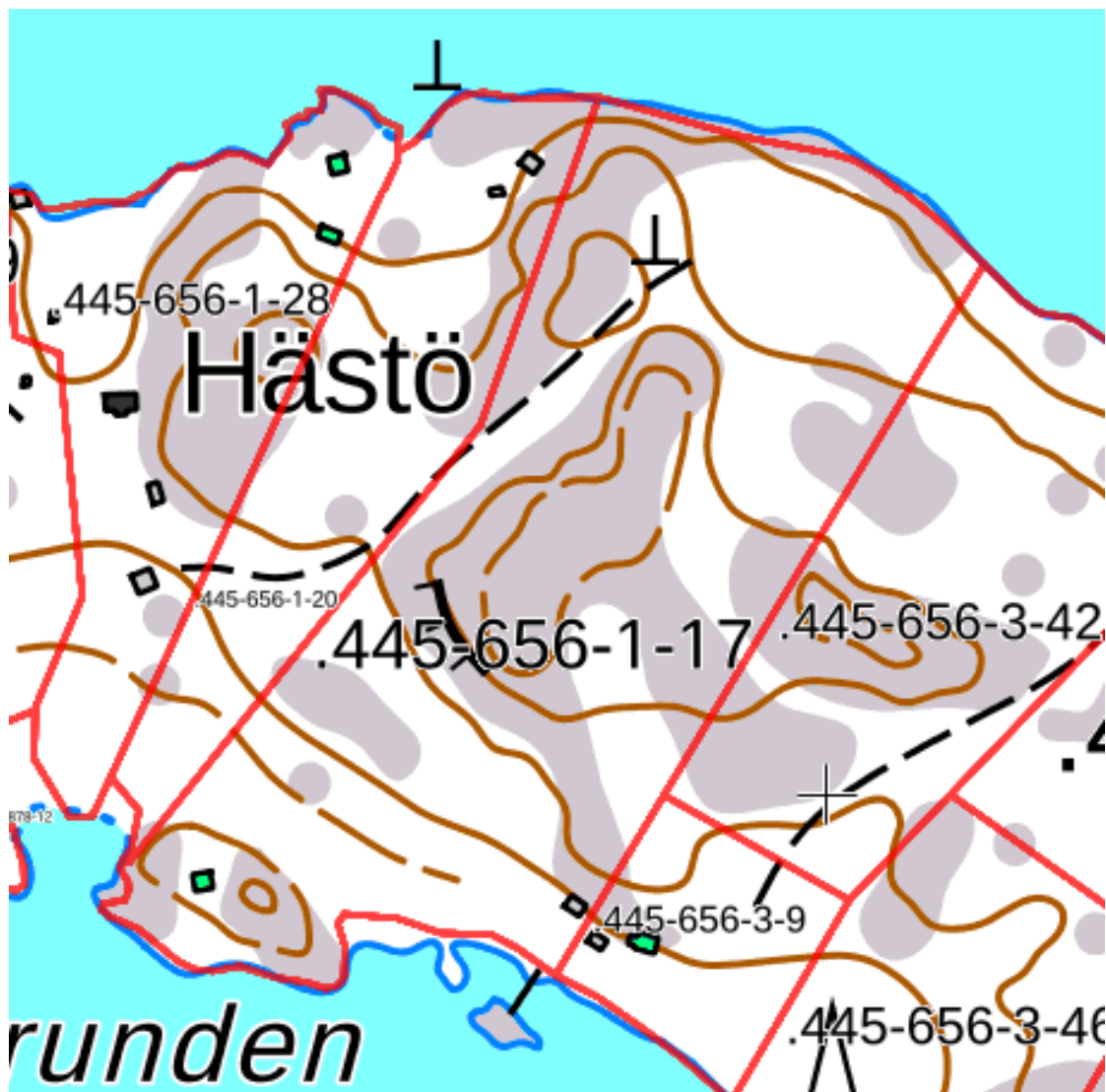
Kaava-alueen (445-656-1-17) kiinteistörajat.

Lounaisniemekkeellä, missä asuntorakennus sijaitsee, kasvaa maisemallisesti hyvin suojaava sekametsä. Muutoinkin alueella kasvaa vahvaa puustoa, pääosin mäntyä.